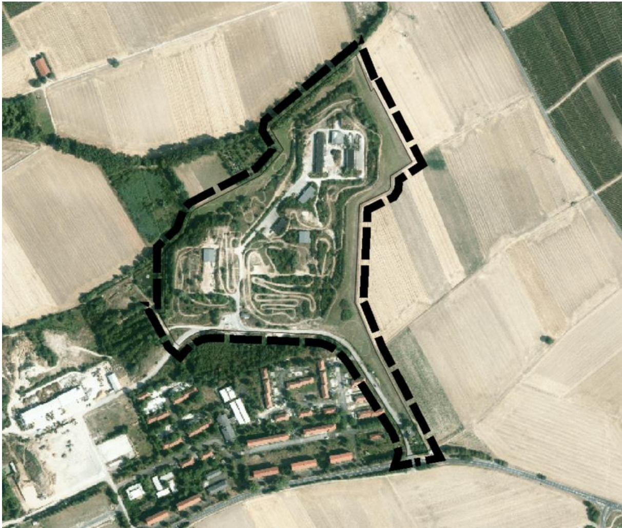
Abb. 1: Lage des Geltungsbereiches im Luftbild.