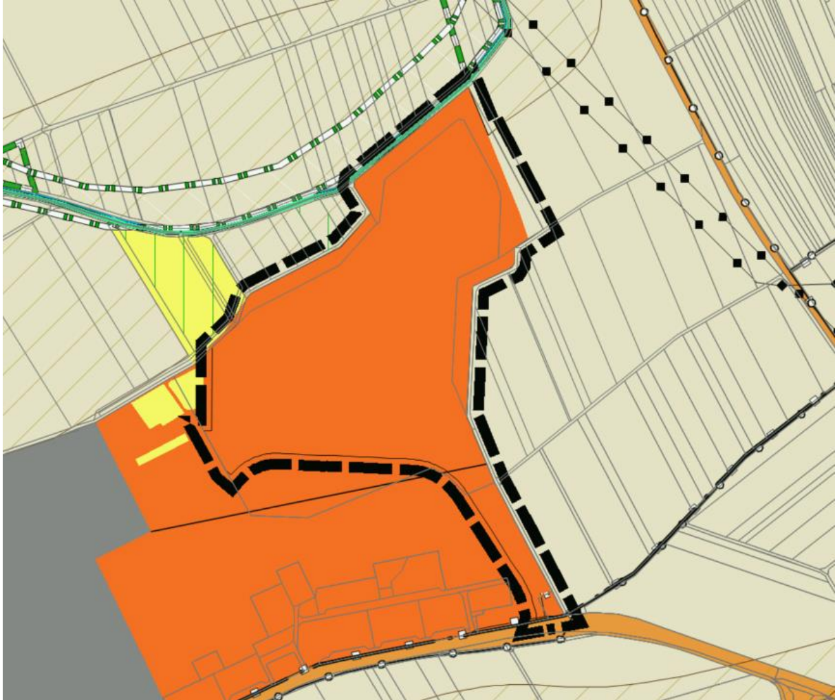
Abb. 4: Ausschnitt aus dem geltenden Flächennutzungsplan 2030.

Der geltende Flächennutzungsplan stellt im Geltungsbereich Sonderbaufläche: Offroad – Fahrbetrieb / Entwicklung / Veranstaltung sowie im südlichen Teil Sonderbaufläche: Offroad – Unterkunft / Freizeiteinrichtungen / Veranstaltung dar.