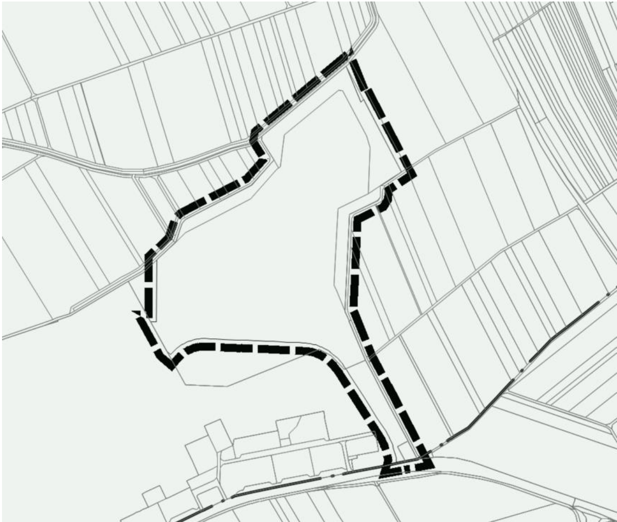
Abb. 2: Geltungsbereich im Katasterausschnitt.