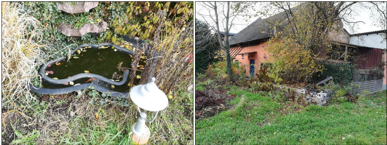
Abbildung 6: Kleiner Teich innerhalb des angelegten Gartens (Foto links); Blick nach Nordwesten auf den verwilderten Gartenteil sowie die Scheune (rückwertig) und den Schuppen (vor der Scheune) (Foto rechts)

Unterhalb des Dachvorsprungs von Anbau 1 befinden sich hofseitig zwei Schwalbennester (vgl. Mehlschwalben) (siehe Abbildung 7).