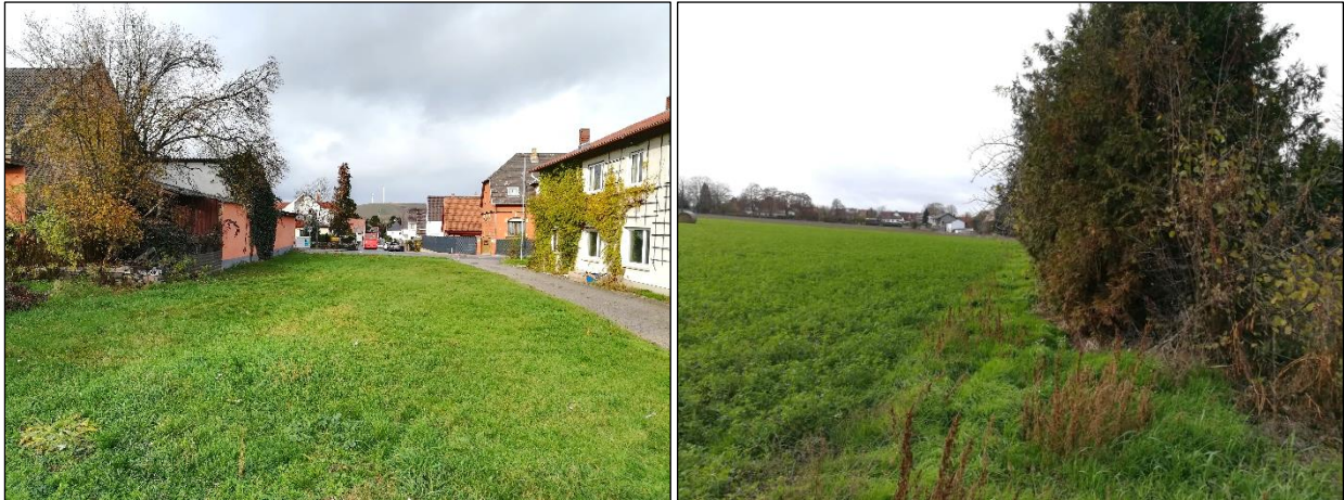
Abbildung 8: Blick nach Norden auf die Wiesenfläche östlich der vorhandenen Bebauung der „Rheinhestenstube“ (Foto links); Ackerflächen unmittelbar südlich des Areals (Foto rechts)

Im Garten ist ein kleiner, künstlich angelegter Teich vorhanden (Fläche ca. 1 m 2 ). Bis auf Teich befinden sich innerhalb des Plangebietes keine Fließ- oder Stehgewässer. Ca. 375 m nördlich bzw. 460 m südöstlich des Plangebietes verläuft die Selz . Dort sind jeweils auch Stehgewässer randlich ausgeprägt.