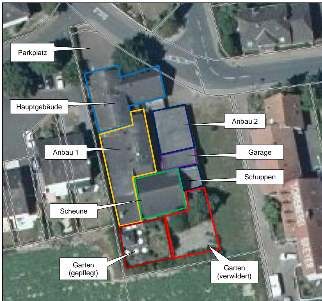
Abbildung 2: Beschreibung der Bestandsgebäude anhand der Ortsbesichtigung (Kartengrundlage: LVerGeoRP 2020)

Dem Hauptgebäude nördlich vorgelagert befindet sich ein kleiner Parkplatz mit Grünfläche und einem mittelaltrigen Einzelbaum (ca. 30 cm Bruthöhen-Stammdurchmesser). Zur Grundstücksgrenze nach Westen und Süden ist eine schmale Hecke ausgeprägt (siehe Abbildung 3, Foto links). An das Hauptgebäude schließt südlich ein voll ausgebauter Anbau der Gaststätte an (Anbau 1; siehe Abbildung 3, Foto rechts). Ein weiterer Anbau mit Wellblechdach und offener Lagerfläche im Obergeschoss befindet sich östlich (Anbau 2; siehe Abbildung 4, Foto links). Dort ist wiederum südlich eine Garage (ebenfalls mit offener Lagerfläche im Obergeschoss), ein kleiner überdachter, offener Schuppen (siehe Abbildung 4, Foto rechts) sowie eine große Scheune vorhanden (siehe Abbildung 5). In Verlängerung zu Anbau 1 befindet sich eine kleine gepflegte Gartenfläche mit Pergola (siehe Abbildung 3, Foto rechts) und kleinem Teich (siehe Abbildung 6, Foto links). Nach Osten setzt sich der Garten fort, ist aber verwildert (siehe Abbildung 6, Foto rechts). Hier ist ein Einzelbaum mittleren Alters (Bruthöhen-Stammdurchmesser ca. 25 cm) sowie ein großer Hasel-Strauch vorzufinden.