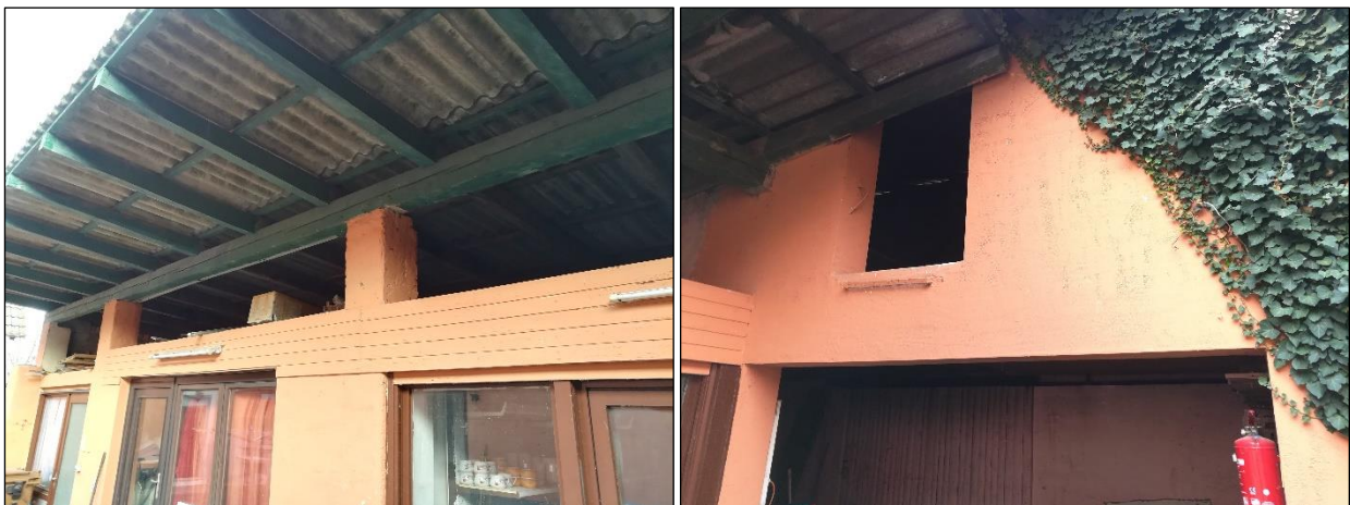
Abbildung 4: Blick auf den Anbau 2 sowie Garagen mit jeweils offener Lagerfläche unterhalb des Dachs