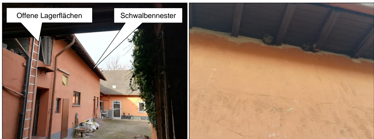
Abbildung 7: Hof mit Blick auf den Anbau 1 (Foto links) und Schwalbennester unterhalb des Dachvorsprungs von Anbau 1 hofseitig (Foto rechts)

Unterhalb des Dachvorsprungs von Anbau 1 befinden sich hofseitig zwei Schwalbennester (vgl. Mehlschwalben) (siehe Abbildung 7).