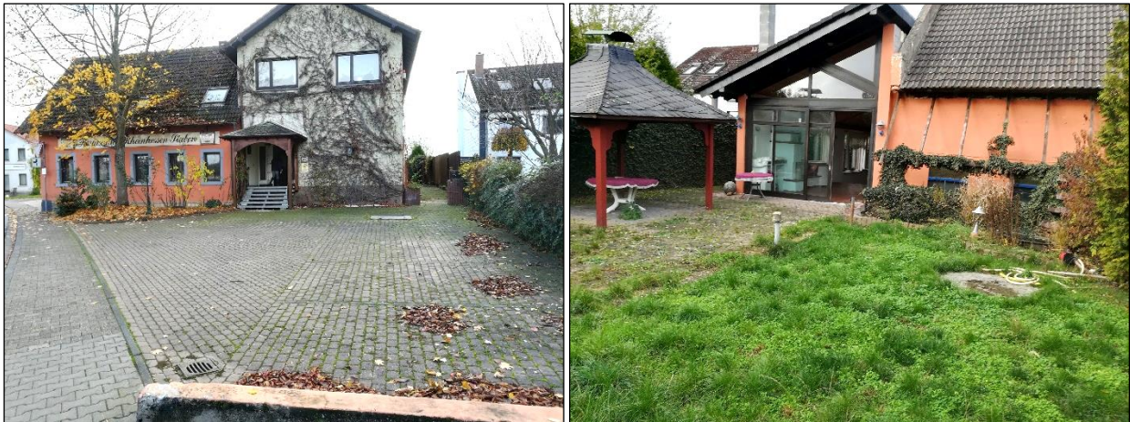
Abbildung 3: Parkplatzfläche mit Blick nach Süden auf das Hauptgebäude der „Rheinhausenstube“ und Baumbestand (Foto links); Blick nach Norden auf den angelegten Garten mit Pergola und Anbau 1 sowie der Scheune im rechten Bildbereich (Foto rechts)