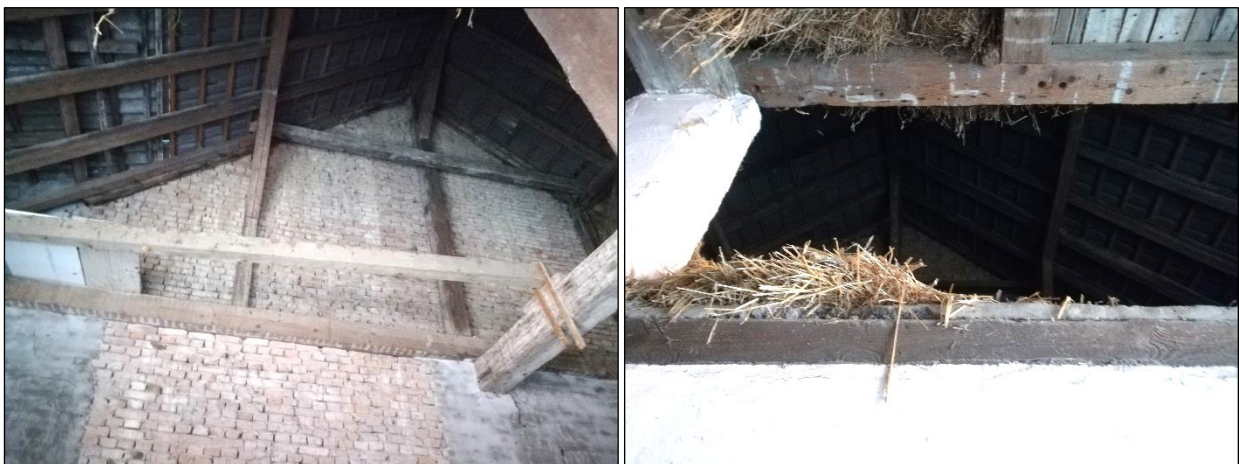
Abbildung 5: Blicke in den Giebelbereich der Scheune