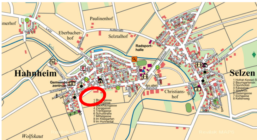
Abbildung 1: Übersichtsplan

Die Genehmigungsplanung zum Anschluss an die „Obere Hauptstraße“ (L432) ist gesondert dem Landesbetrieb für Mobilität vorgelegt worden.