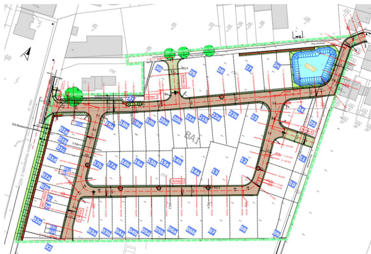
Abbildung 2: Übersichtslageplan Straßenbau

Darüber hinaus ist durch den gewählten Pflasterbelag in den Erschließungsstraßen diese optisch gegenüber der Oberen Hauptstraße als Wohnstraße abgehoben.